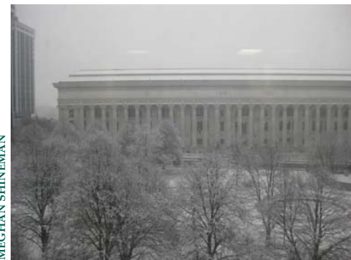
New York State Education Building