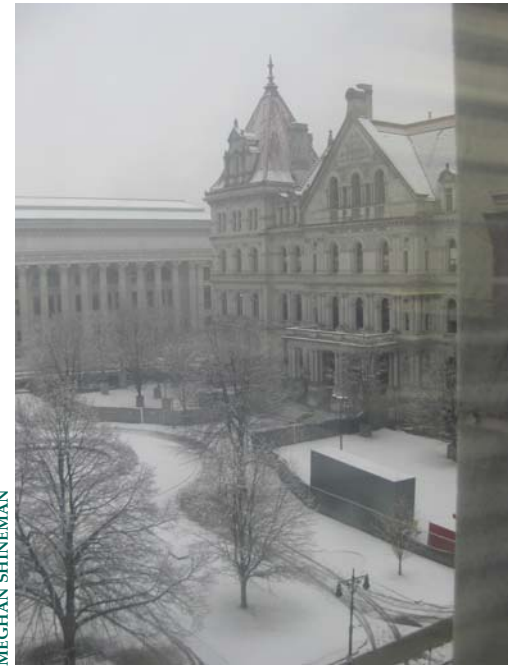
New York State Capital Building snowed in